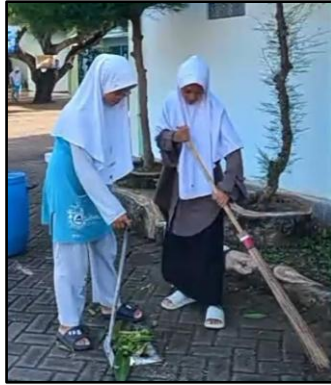
Gambar : 2 Piket Kebersihan Santri

Selain kegiatan kebersihan, Pondok Pesantren Al Mashduqiah juga menyelenggarakan kegiatan yang mendalami spiritualitas para santri, seperti retreat rohani atau i'tikaf pada bulan Ramadhan atau waktu-waktu tertentu. Kegiatan ini bertujuan untuk membantu santri memperdalam hubungan mereka dengan Allah, serta memberikan kesempatan bagi mereka untuk berintrospeksi dan memperkuat ketenangan batin. Dalam suasana yang penuh dengan kesendirian dan ketenangan, santri diberikan kesempatan untuk lebih mendekatkan diri kepada Tuhan, dengan fokus pada ibadah, doa, dan tafakur. Kegiatan seperti ini tidak hanya membangun aspek spiritualitas, tetapi juga membantu mereka mengembangkan kedisiplinan pribadi yang lebih tinggi dalam menjalani kehidupan keagamaan. Santri juga diberikan pelajaran tentang kitab kuning, yang berisi ajaran-ajaran Islam klasik. Pembelajaran kitab kuning ini penting untuk memperdalam pemahaman agama, serta mengajarkan nilai-nilai akhlak yang menjadi dasar dalam membentuk karakter. Kitab-kitab klasik ini seringkali berisi ajaran-ajaran moral dan etika yang menekankan pentingnya menjaga akhlak yang baik dalam kehidupan sehari-hari, sebuah ajaran yang sesuai dengan tujuan pesantren untuk mendidik generasi muda yang memiliki akhlak mulia (Jufriзал, 2023).