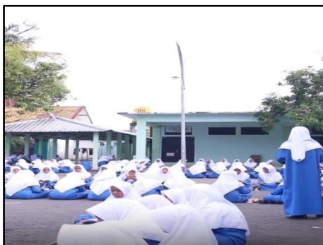
Gambar : 4 Apel Pagi Persiapan Kegiatan Belajar Mengajar

sebelum memulai kegiatan pembelajaran agar santri mampu mengatur waktu semuanya membutuhkan disiplin waktu yang tinggi. Melalui pembiasaan ini, santri tidak hanya belajar untuk mengikuti aturan, tetapi juga memahami pentingnya aturan dalam kehidupan sosial dan spiritual mereka. Disiplin yang dibangun dalam kehidupan sehari-hari di pesantren ini berperan penting dalam membentuk pribadi yang bertanggung jawab, jujur, dan dapat diandalkan, serta mampu beradaptasi dengan baik di tengah masyarakat yang lebih luas (Maryono, 2022). Pembentukan karakter melalui disiplin di pesantren Al Mashduqiah tidak hanya mengajarkan tentang ketaatan pada aturan, tetapi juga tentang bagaimana aturan tersebut dapat membantu mereka hidup secara terstruktur dan bermakna.