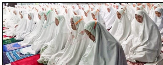
Gambar : 1 Sholat Berjama'ah Santri

Pentingnya pembiasaan ibadah dalam pembentukan karakter juga tidak dapat dipisahkan dari nilai-nilai moral yang ditanamkan melalui aktivitas-aktivitas keagamaan lainnya di pesantren, seperti kajian agama dan pengajian. Pembiasaan sholat berjamaah di Pondok Pesantren Al Mashduqiah mengajarkan santri untuk tidak hanya melaksanakan ibadah dengan benar, tetapi juga memahami makna dan tujuan dari setiap gerakan dalam sholat. Melalui pemahaman yang lebih dalam, santri diharapkan dapat meningkatkan kualitas ibadah mereka serta membangun karakter yang lebih baik. Pembiasaan ibadah ini tidak hanya berdampak pada pengembangan spiritual dan moral, tetapi juga berperan besar dalam pembentukan kepribadian santri yang disiplin, bertanggung jawab, dan menjunjung tinggi nilai-nilai kebersamaan. Pendidikan agama yang berbasis pada pembiasaan ibadah seperti sholat berjamaah di pesantren memberikan kontribusi yang sangat penting dalam pembentukan karakter santri yang lebih baik, yang tidak hanya terlihat dari tindakan mereka, tetapi juga dari sikap dan perilaku sosial mereka di tengah-tengah masyarakat (Primaresty et al., 2023).