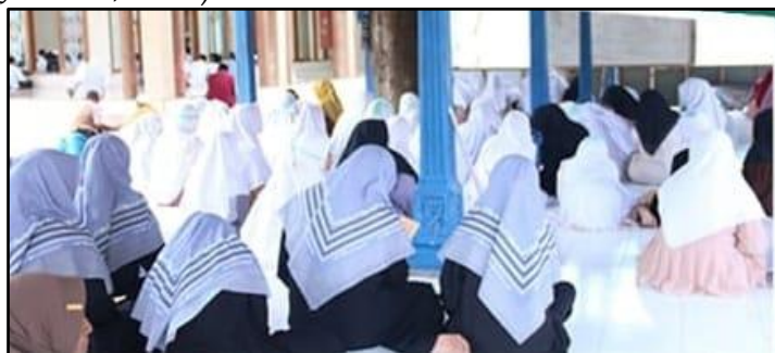
Gambar : 3 Kajian Kitab Santri

Selain kegiatan kebersihan, Pondok Pesantren Al Mashduqiah juga menyelenggarakan kegiatan yang mendalami spiritualitas para santri, seperti retreat rohani atau i'tikaf pada bulan Ramadhan atau waktu-waktu tertentu. Kegiatan ini bertujuan untuk membantu santri memperdalam hubungan mereka dengan Allah, serta memberikan kesempatan bagi mereka untuk berintrospeksi dan memperkuat ketenangan batin. Dalam suasana yang penuh dengan kesendirian dan ketenangan, santri diberikan kesempatan untuk lebih mendekatkan diri kepada Tuhan, dengan fokus pada ibadah, doa, dan tafakur. Kegiatan seperti ini tidak hanya membangun aspek spiritualitas, tetapi juga membantu mereka mengembangkan kedisiplinan pribadi yang lebih tinggi dalam menjalani kehidupan keagamaan. Santri juga diberikan pelajaran tentang kitab kuning, yang berisi ajaran-ajaran Islam klasik. Pembelajaran kitab kuning ini penting untuk memperdalam pemahaman agama, serta mengajarkan nilai-nilai akhlak yang menjadi dasar dalam membentuk karakter. Kitab-kitab klasik ini seringkali berisi ajaran-ajaran moral dan etika yang menekankan pentingnya menjaga akhlak yang baik dalam kehidupan sehari-hari, sebuah ajaran yang sesuai dengan tujuan pesantren untuk mendidik generasi muda yang memiliki akhlak mulia (Jufriзал, 2023).